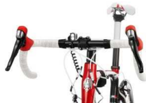
バイク取付例(トレールスピード)

インテリジェントライト、ハイパワーLED 1ケ+ワイドビーム LED 2ケ使用。 電源を切った時、LEDの色で電池残量がわかります。 電池残量により、2種類のセーブモードへ自動的に移行します。 明るさ : 1300ルーメン(最大)、ワイドビームで近場も明るく照らせます。 照射距離 : 160m(最大)、リチウムイオン充電電池付(USB 充電)