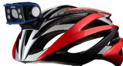
ヘルメット取付例