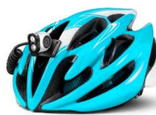
ヘルメット取付例(トレールスピード)